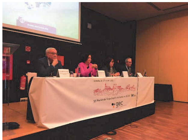
Acto de inauguración. Mañana del 25 abril.