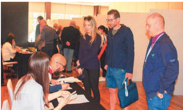
Recogida de documentación. Tarde del 24 abril.

Fue allá por 2018 cuando el Grupo de Investigación en Materiales de Carbón, de la Universidad de Granada, recibió el encargo para la organización de la XV Reunión del Grupo Español del Carbón (GEC-20). La presentación del mismo se llevó a cabo en Alicante, durante la celebración del CESEP de 2019, y las fechas elegidas fueron del 26 al 29 de abril de 2020. Puestos manos a la obra con mucha ilusión, estando ya el programa científico terminado, y las inscripciones pagadas nos sobrevino la pandemia, sus consecuencias, y tuvimos que suspender la Reunión. Esto implicó la cancelación de los acuerdos, precontratos y contratos con las empresas e entidades participantes, tanto del programa científico como social del GEC-20, así como la devolución de las cuotas, tarea administrativa singularmente tediosa. Hubo algunos intentos de reactivar el GEC-20, otoño 2020 y primavera de 2021, pero la inseguridad constante tanto desde el punto de vista sanitario, como jurídico-administrativo, nos hizo desistir. Finalmente, y de acuerdo con la Junta Directiva del GEC, cruzamos los dedos y nos lanzamos a una segunda aventura organizativa con vistas al 24 al 27 de abril de 2022, fechas en las que finalmente se pudo celebrar.