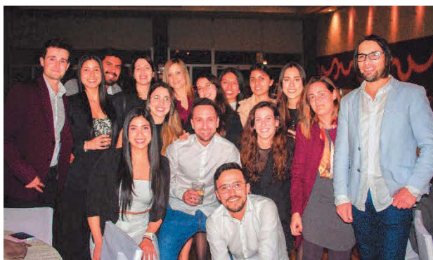
Cena de clausura. Noche del 27 de abril.