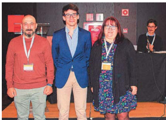
Ganador del Premio JJII-GEC.