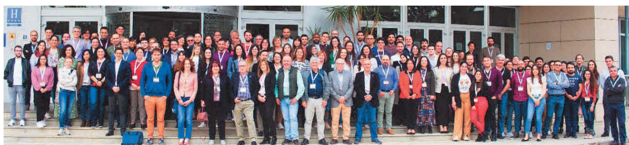
Asistentes a la XV Reunión del GEC. Granada, 26/04/2022

No quiero acabar esta reseña sin dejar constancia de nuestro más sincero agradecimiento, en primer lugar, a todos los participantes de la XV Reunión del GEC, por venir a Granada, por su compromiso con la misma en todas sus facetas, por la comprensión con los inconvenientes, por el cariño mostrado, porque somos GEC. Agradecemos a la Junta Directiva del GEC el soporte, la ayuda, y la confianza depositada en el Comité Organizador en todo momento. Y finalmente, gracias también a todos los estudiantes y visitantes del Grupo de Investigación en Materiales de Carbón de la UGR, que no figuran en el comité organizador, pero que sin su ayuda tampoco hubiera sido posible la celebración de esta Reunión. Gracias a todos.