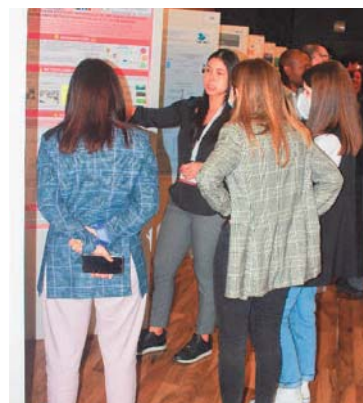
Sala de carteles.