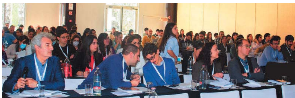
Sala de la reunión. Comunicaciones orales.