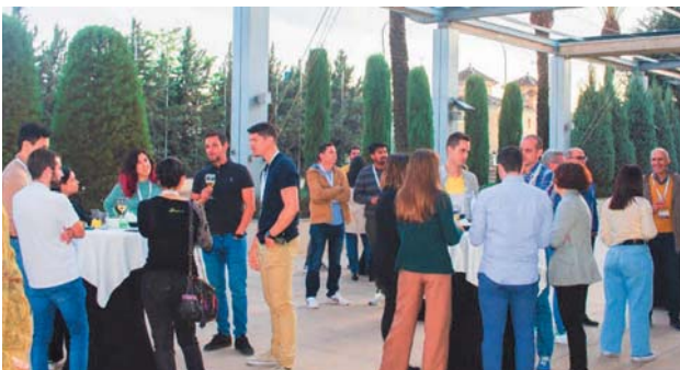
Cóctel de bienvenida. Tarde del 24 abril.

Comenzamos la tarde del 24 de abril de 2022, durante la cual la mayoría de participantes recogió la tradicional documentación de la Reunión, finalizando con un cóctel-cena de bienvenida en la sede de la XV Reunión del GEC, el Hotel Abades Nevada