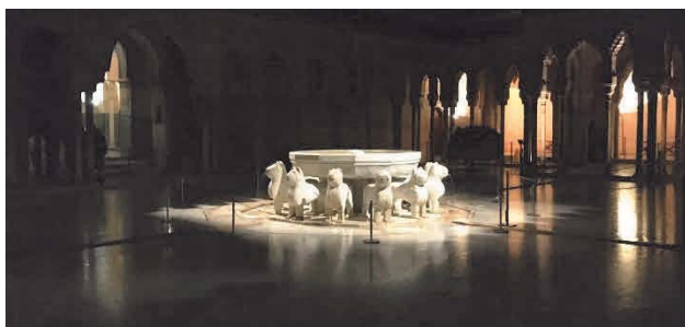
Patio de los Leones, Alhambra. Noche del 26 de abril.